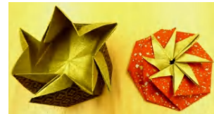
「たとう折り袋」 (SAサロンのポチ袋と同じ)