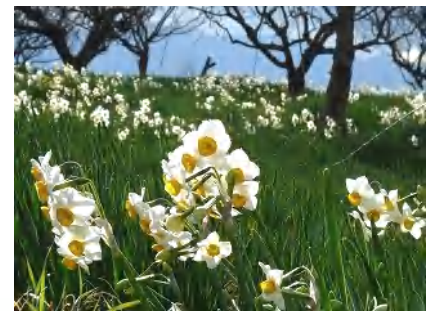
リサイクル公園の水仙 1/20 (梅は まだまだ…)