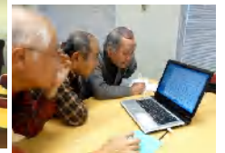
パソコン塾 ●サークル活動 折り紙