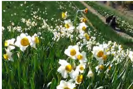
フォレストガーデンの水仙 1/22