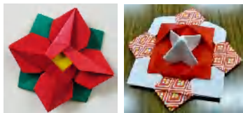
「椿」と 初めての人に「こま」