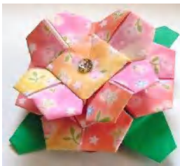
9月作品 花ブローチ