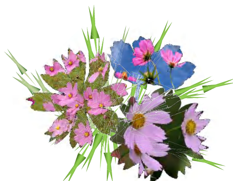
透過したコスモスの図形に コスモスの写真を入れました

❏ サザンVネットについて 質問・意見・提案などが ありましたら、事務局まで 電話またはメールをください。 《 サザンVネット事務局(秋田) Tel 090-3702-7530 メール savn18@yahoo.co.jp 》