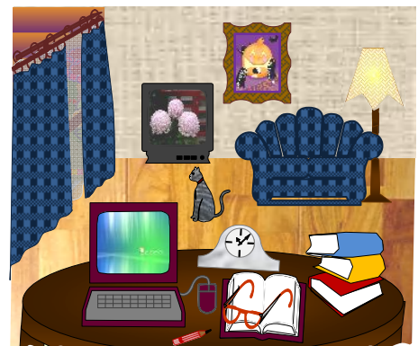
📖 秋の夜長 本のある部屋 📖

「サザンVネット通信」担当者:川本正子(編集/作成)・秋田(写真/印刷)・藤森(発送)