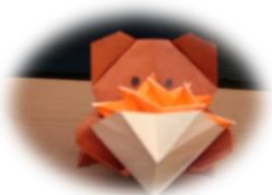
3月の作品 クマしゃん