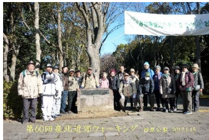
第 60 回 泉北近郊ウォーキング 泉北公園 2017.1.15