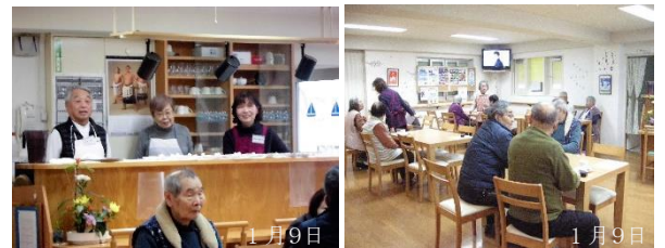
スタッフの皆さんと和やかな喫茶風景

御池台「さつき会」で (午前) 12/19, 26 各 4 名 (午後) 1/9 3 名