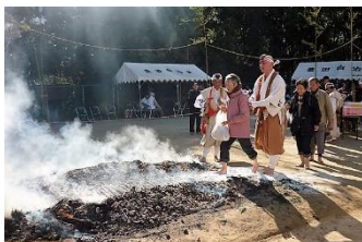
これから「火渡り」しようとされる会員!

この日は、最低 -0.1℃ 最高 5℃ の中 ウォーキングと福德寺の「火渡り」に皆さん元気に参加されました。