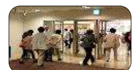
笑顔でお礼の挨拶