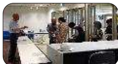
こんにちは・笑顔で出迎え