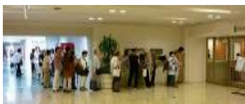
開場1時間前から参加者の列ができます