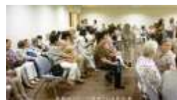
休憩時ロビーで談笑される参加者

7月13日のうたごえ広場は良い天気にも恵まれ盛況でした。演奏の先生方もスタッフも満6年を迎えました。参加者の中には同じ6年生が多数おられます。1時間前から並んで待っていています。休憩時には、歌う仲間の笑顔が溢れています。 “楽しく 和やかに” これからも続けます。